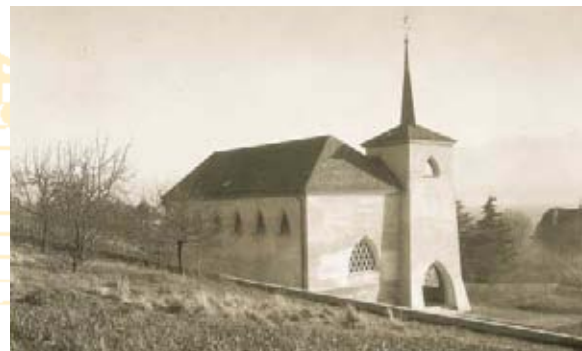
L'église en 1930, peu après sa construction

1995: En automne, le chauffage à air chaud est révisé. Il devient dès lors tellement efficace que c'est le coup de grâce