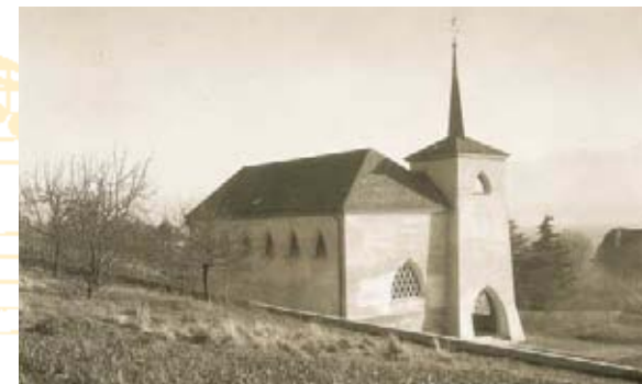
L'église en 1930, peu après sa construction

1995: En automne, le chauffage à air chaud est révisé. Il devient dès lors tellement efficace que c'est le coup de grâce