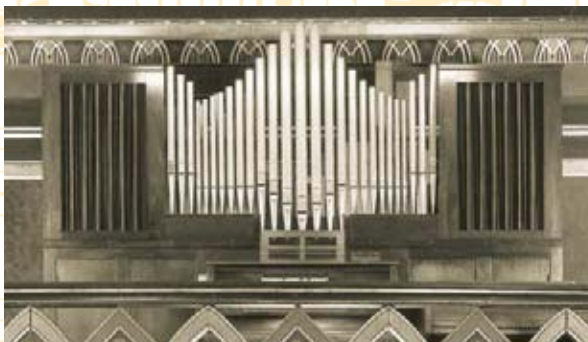
L'ancien orgue de 1957

pour le pauvre instrument qui rend définitivement l'âme!